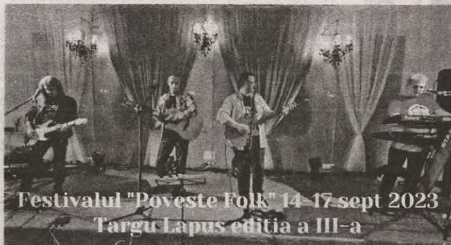
Festivalul "Poveste Folk" 14-17 sept 2023 Targu Lapus editia a III-a

Cea de-a III-a ediție a Festivalului "Poveste Folk" va avea loc în perioada 14-17 septembrie 2023. Sunteți așteptați să vă bucurați de muzica folk adusă de artiști