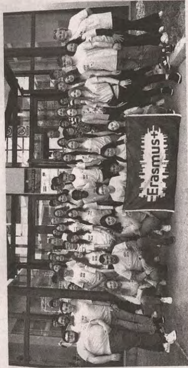
Pagină realizată de Maria STOICA

Echipa care a muncit la elaborarea documentației a fost constituită din conducerea liceului și coordonatorii proiectelor din perioada evaluată.