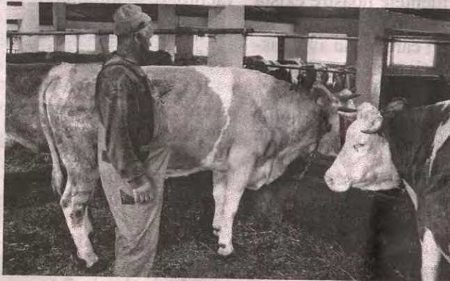
Microfermă de vaci din Vălenii Șomcutei

Temperatura în adăposturi trebuie să fie între 5 și 25 de grade Celsius, iar animalele