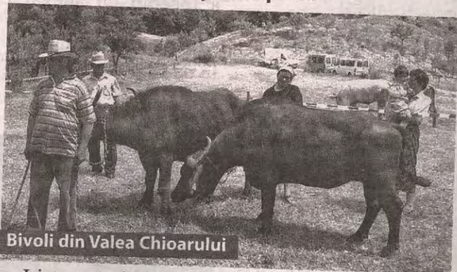
Bivoli din Valea Chioarului

Ministerul Agriculturii îi susține financiar, timp de 5 ani, pe crescătorii care cresc animale din rase locale aflate în pericol, valoarea plăților compensatorii fiind de 200 euro/cap pentru bovine și cabaline, 87 euro pentru oi, 40 euro pentru capre și 176 euro pentru porci.